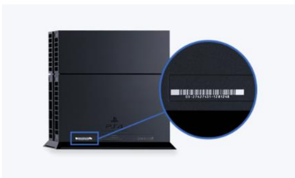
Afbeelding PS4-console (basis)

Het serienummer bevindt zich aan de achterkant van het systeem, linksonder in het chassis.