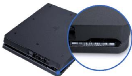
Afbeelding PS4-console Slim

Het serienummer bevindt zich onder de rand boven de stroompoort. U moet het systeem omdraaien om dit nummer te zien.