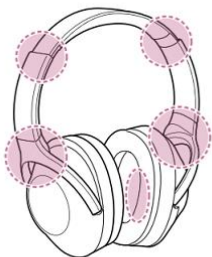
Afbeelding PlayStation headset Pulse 3D

Het serienummer bevindt zich meestal op de hoofdband of onder het kussen van de oorschelp, als QR code en/of in schrift.