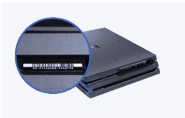
Afbeelding PS4-console Pro

Het serienummer bevindt zich onder de rand, tegenover de systeempoorten. U moet het systeem omdraaien om dit nummer te zien.