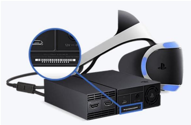
Afbeelding PlayStation VR