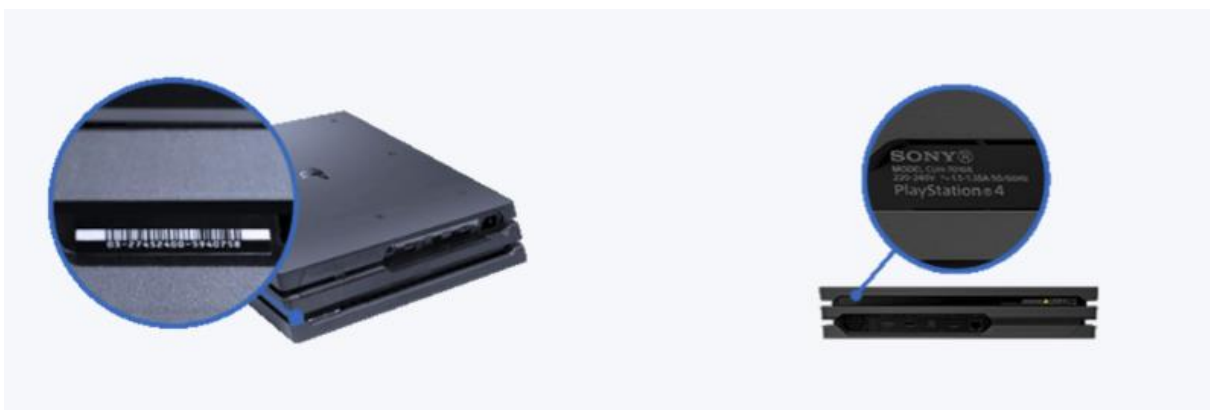
Afbeelding PS4-console Pro

Het modelnummer bevindt zich op de achterkant van het console, boven de systeempoot.