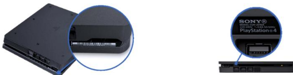
Afbeelding PS4-console Slim

Het modelnummer bevindt zich aan de achterkant van het console, rechts van de voedingspoort.