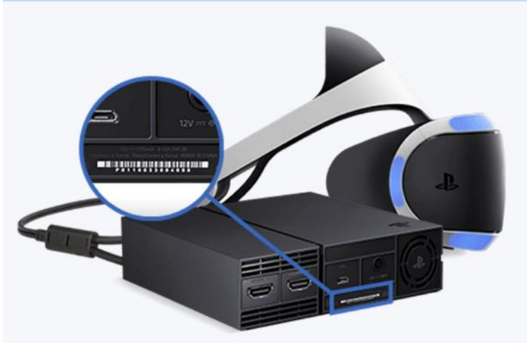
Image PlayStation VR