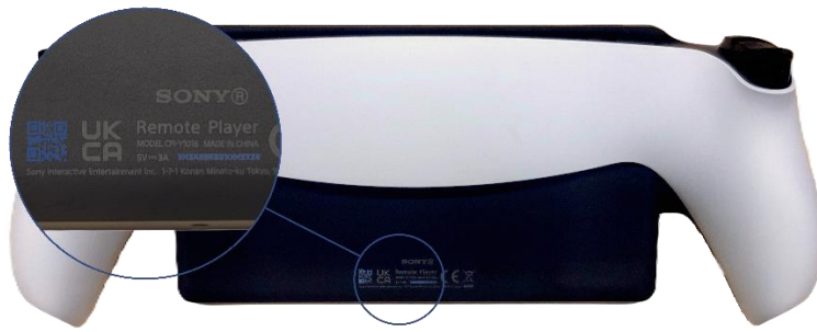
Image PlayStation Portal