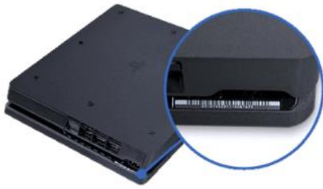
Image Console PS4 Slim