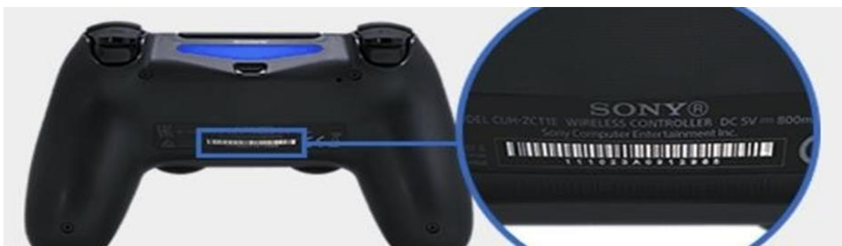
Image Manette PS4

Le numéro de série se trouve au dos de la manette sans fil, sous forme de code-barres et en écriture sous le code-barres.