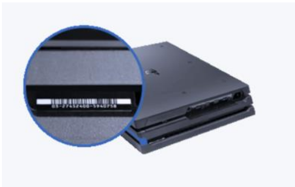
Image Console PS4 Pro

Le numéro de série se trouve sous l'arête, en face des ports système. Vous devez le retourner pour voir ce numéro.