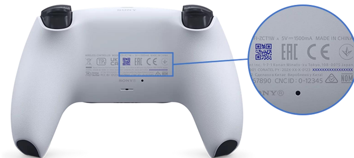
Image Manette PS5

Le numéro de série se trouve au dos de la manette, sous forme de code QR et en écriture sous le code QR.