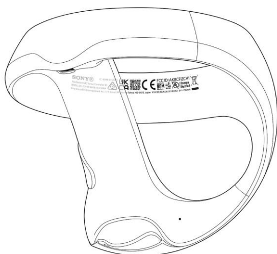
Image Manette PlayStation VR2

Le numéro de série se trouve à l'intérieur de la bague de suivi, sous forme de code QR et en écriture sous le code QR.