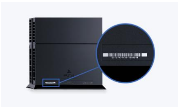
Afbeelding PS4-console (basis)

Het serienummer bevindt zich aan de achterkant van het systeem, linksonder in het chassis.