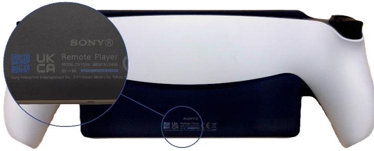
Afbeelding PlayStation Portal