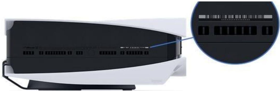
Afbeelding PS5-console (Slim, Disk en Digitaal)