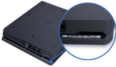
Afbeelding PS4-console Slim