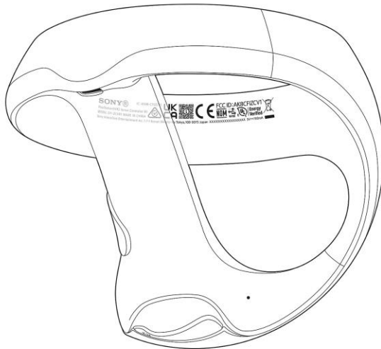
Afbeelding PlayStation VR2-controller

Het serienummer bevindt zich aan de binnenkant van de traceerring, als QR-code en in schrift onder de QR-code.