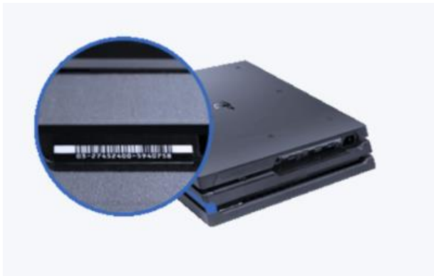
Afbeelding PS4-console Pro

Het serienummer bevindt zich onder de rand, tegenover de systeempoorten. U moet het systeem omdraaien om dit nummer te zien.