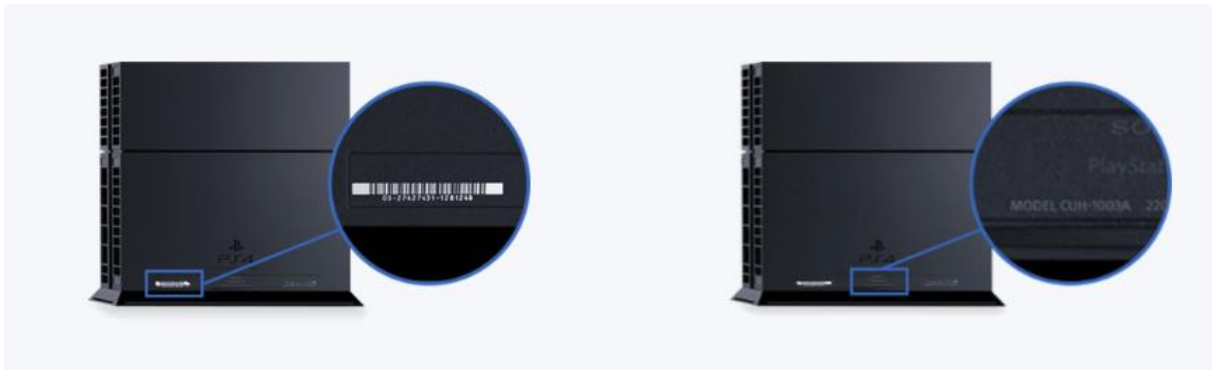
Afbeelding PS4-console (basis)