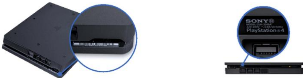
Afbeelding PS4-console Slim

Het modelnummer bevindt zich aan de achterkant van het console, rechts van de voedingspoort.