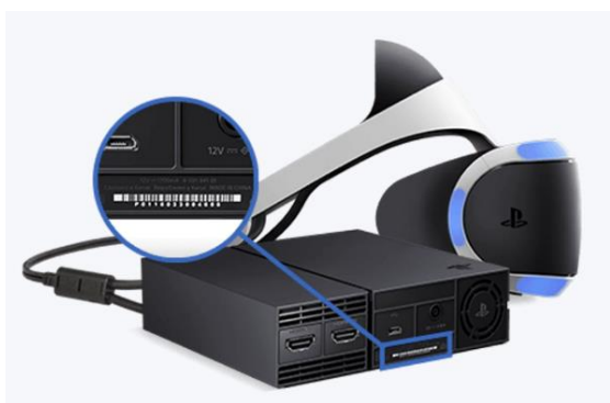
Afbeelding PlayStation VR

CUH-ZVR2 voor de vaste processoreenheid.