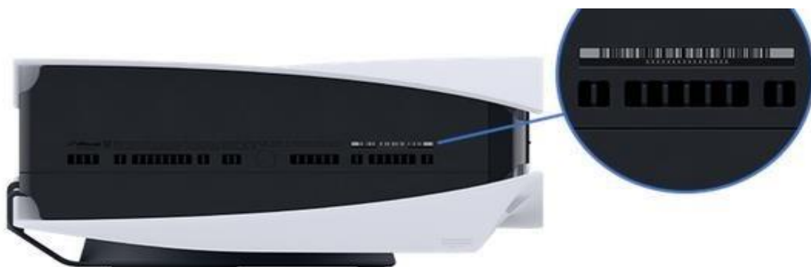
Afbeelding PS5-console (Slim, Disk en Digitaal)

Het modelnummer bevindt zich aan de onderkant van de console als deze verticaal is geplaatst. Verwijder de basis om het serienummer en modelnummer van uw PS5 te onthullen.